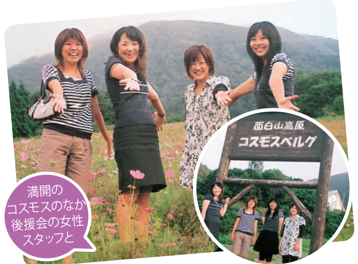
満開の コスモスのなか 後援会の女性 スタッフと

先の「6月定例会」において私は「森化計画」を提案し、自然と緑を守ることの大切さと必要性を訴えてまいりました。